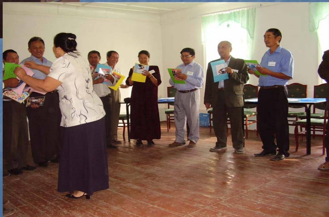
Обучение сообществ внедрению гендерных аспектов в УСРБ