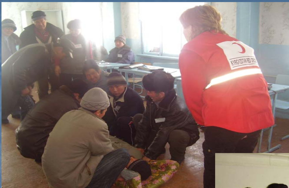
Обучение НОКП членов СКС оказанию первой помощи