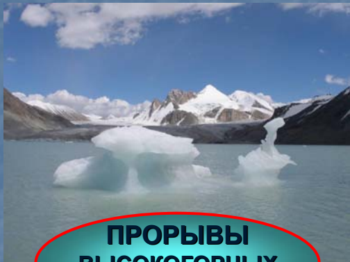
ПРОРЫВЫ ВЫСОКОГОРНЫХ ОЗЕР