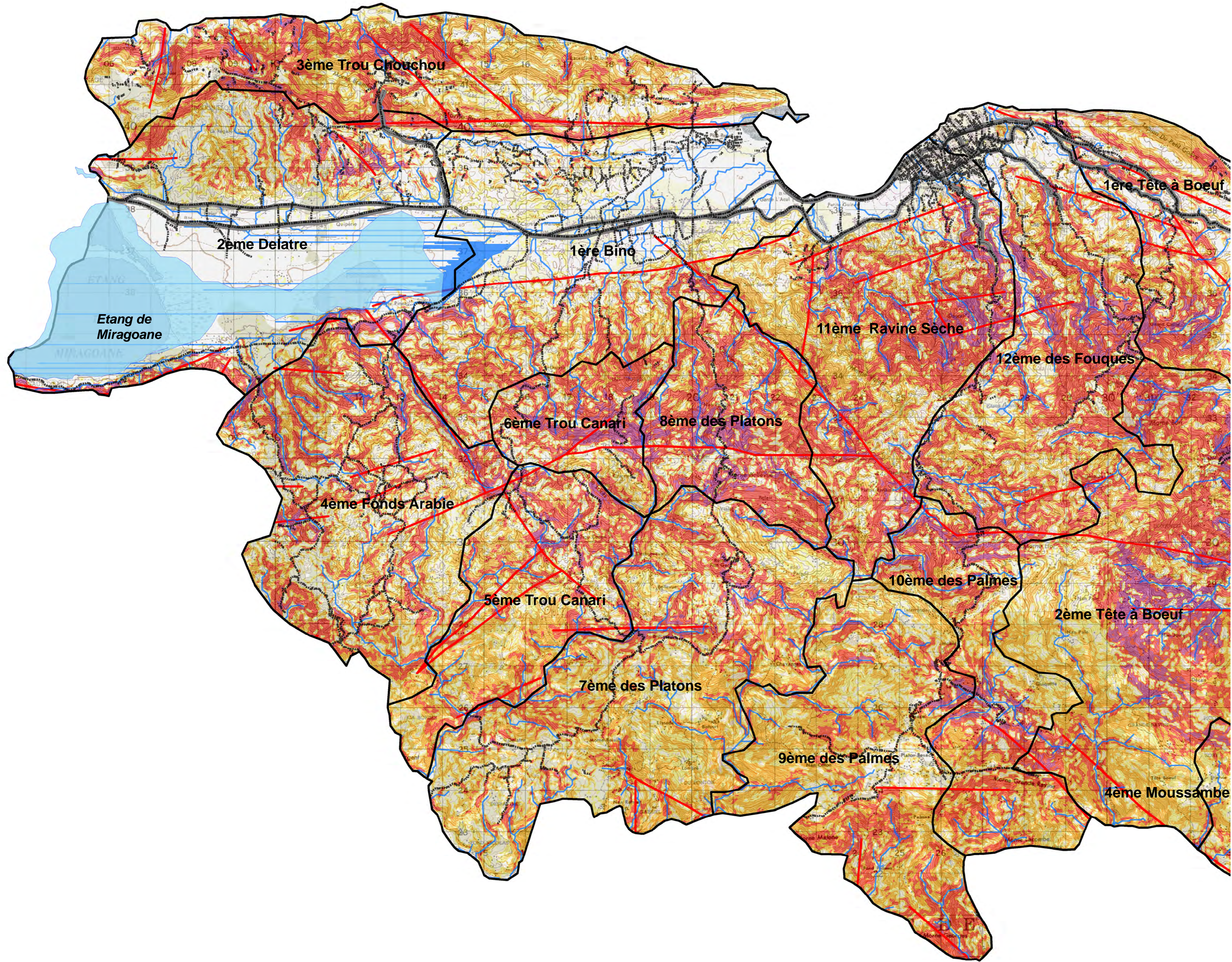
Position zone d'étude