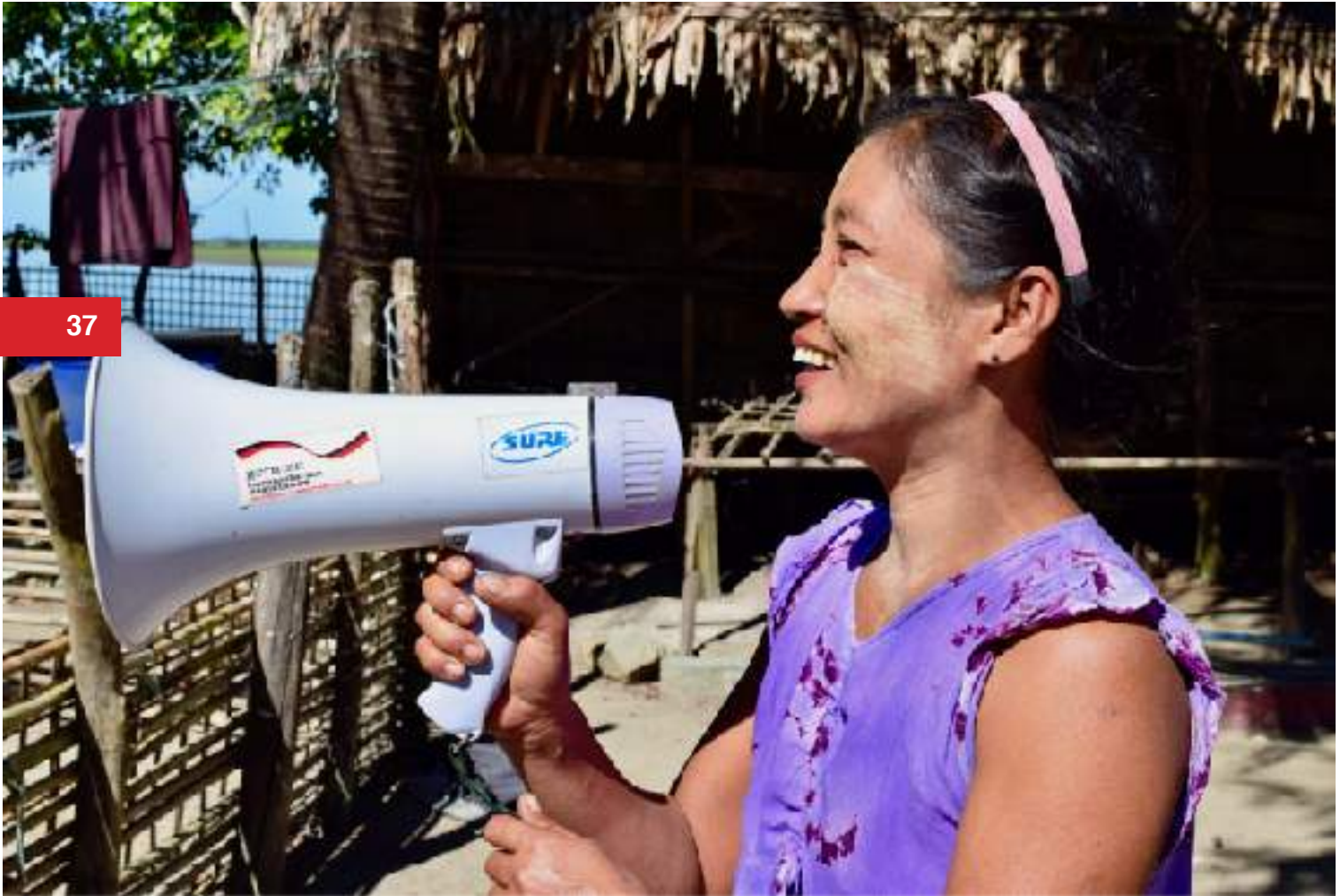
ကယ်ဆယ်ရေးပြောင်းရေး ကော်မတီ၏ အမျိုးသမီးအဖွဲ့ဝင်၊ မုန်တိုင်းကြိုလေ့ကျင့်ခန်းတွင် ညွှန် ကြားမှုများပေးနေစဉ်