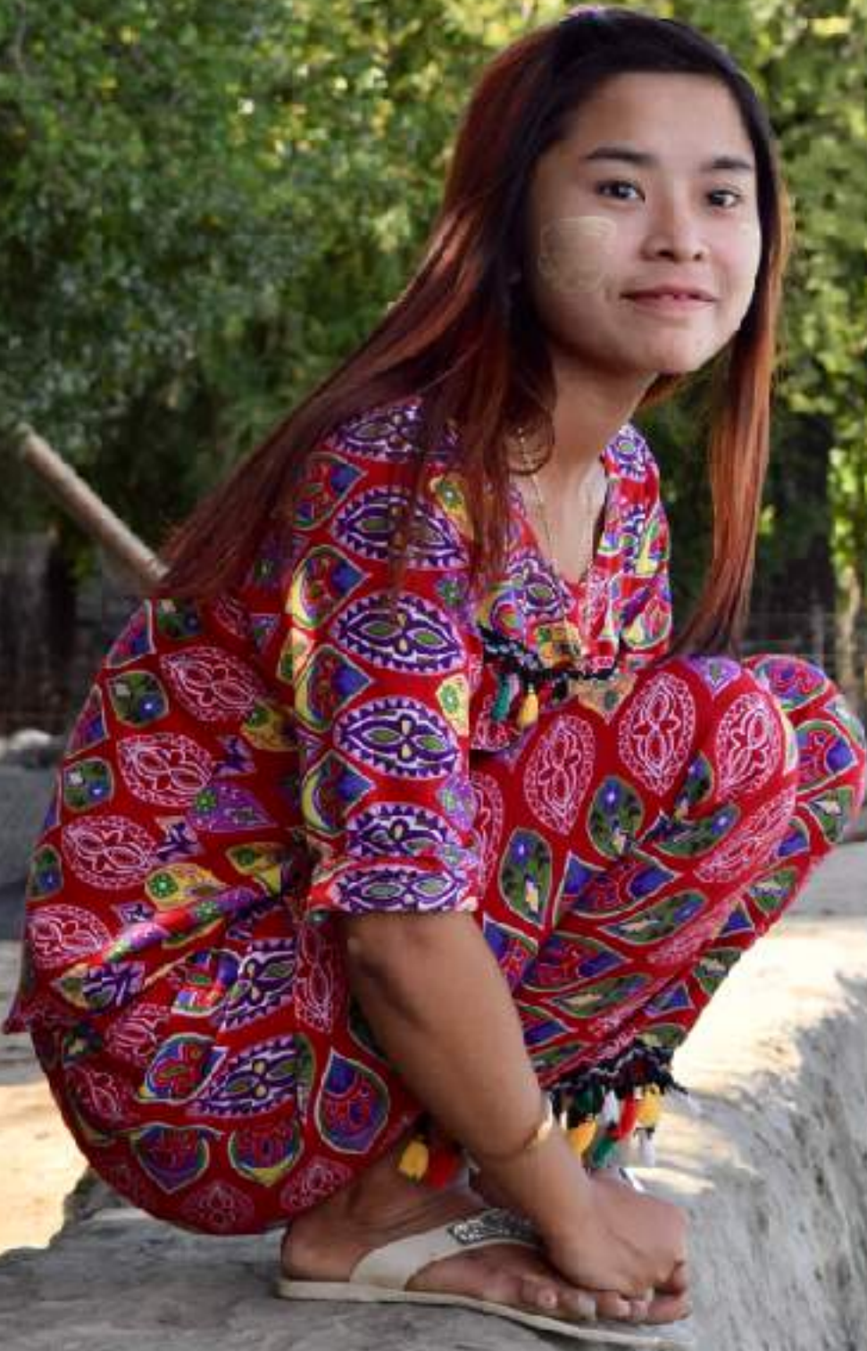
မတ္တလာကြားကျေးရွာမှ မမြတ်ကေခိုင် (ပုဏ္ဏားကျွန်းမြို့နယ်) ဒီရေနှင့် မုန်တိုင်းလှိုင်းလုံးကြီးများ ကာကွယ်နိုင်သော မြစ်ကမ်းပါးထိန်းနံရံပေါ်မှ ဆရာအဖွဲ့အားစောင့်ကြည့်နေစဉ်